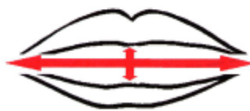
Forme des lèvres (ouverture et étirement) pour la voyelle « I »

La partie innée est rarement suffisante par elle-même sauf chez certaines personnes devenues sourdes jeunes qui s'adaptent très vite et se découvrent un grand talent en lecture labiale. Dans la plupart des cas, il faut compléter la lecture labiale innée par l'apprentissage de sa technique. Car, c'est d'abord une technique et, comme toute technique, elle s'apprend et elle a ses règles.