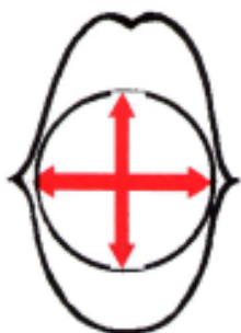
Forme des lèvres (ouverture et étirement) pour la voyelle « A »

Par exemple, en fin d'année, la phrase « meilleurs v.... » signifie évidemment « meilleurs vœux ». Au contraire, si l'on parle cuisine, on comprendra « veau » dans la phrase : « le meilleur v... est sans hormone ».